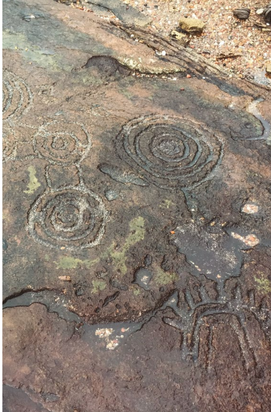
FIGURA 7: ARTE RUPESTRE DEL TERRITORIO LOMERIO